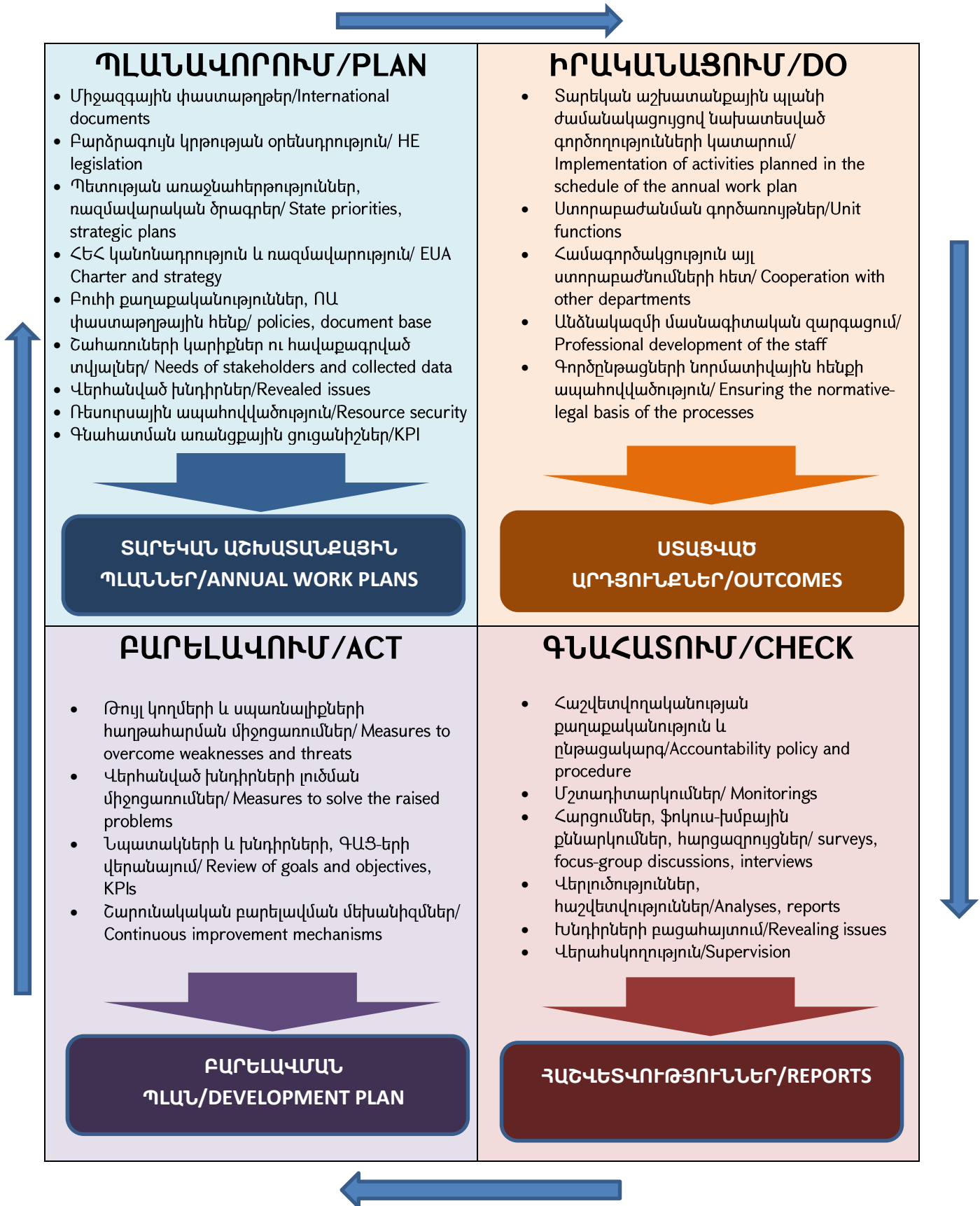
Գծապատկեր/Figure 1. ՊԻԳԲ շրջափուլի կիրառումն ինստիտուցիոնալ մակարդակում/ Implementation of the PDCA cycle at the institutional level